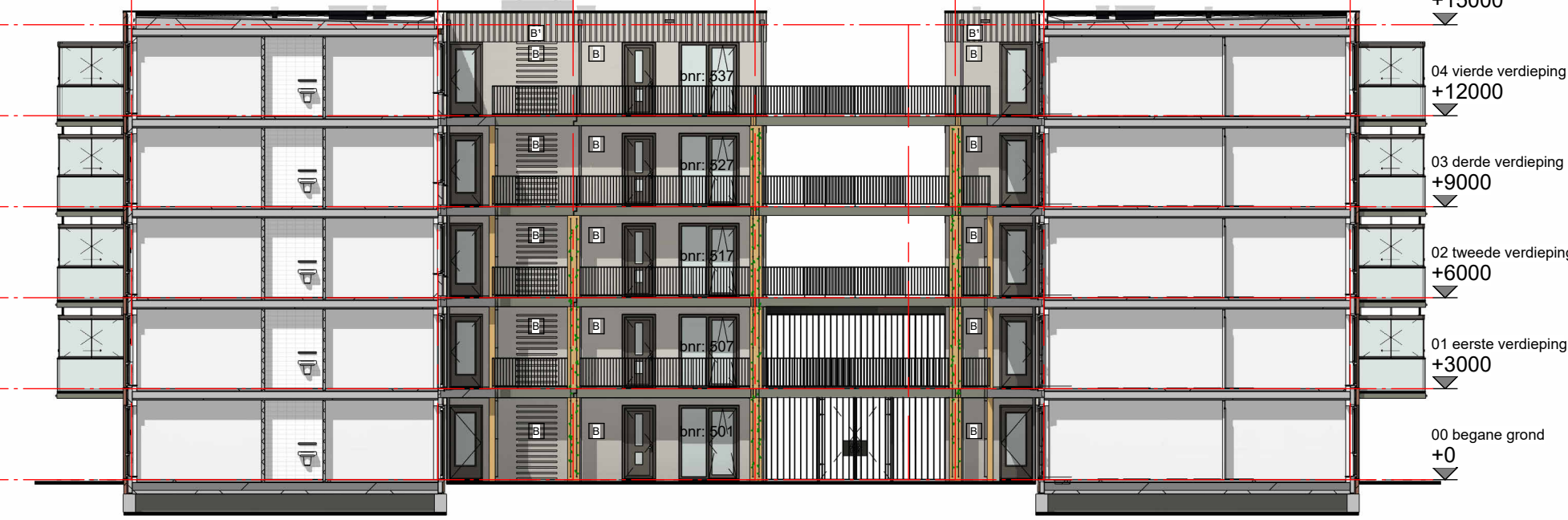
Rechter zijgevel binnenzijde